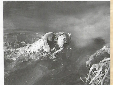
Pour le « rapport à l'eau », le chien doit retrouver le gibier après avoir nagé sur quelques dizaines de mètres et le rapporter à son maître, sur la rive. Il doit le déposer aux pieds de son maître avant de s'ébrouer !