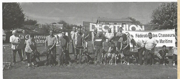
Rassemblement de passionnés aux Eglises d'Argenteuil