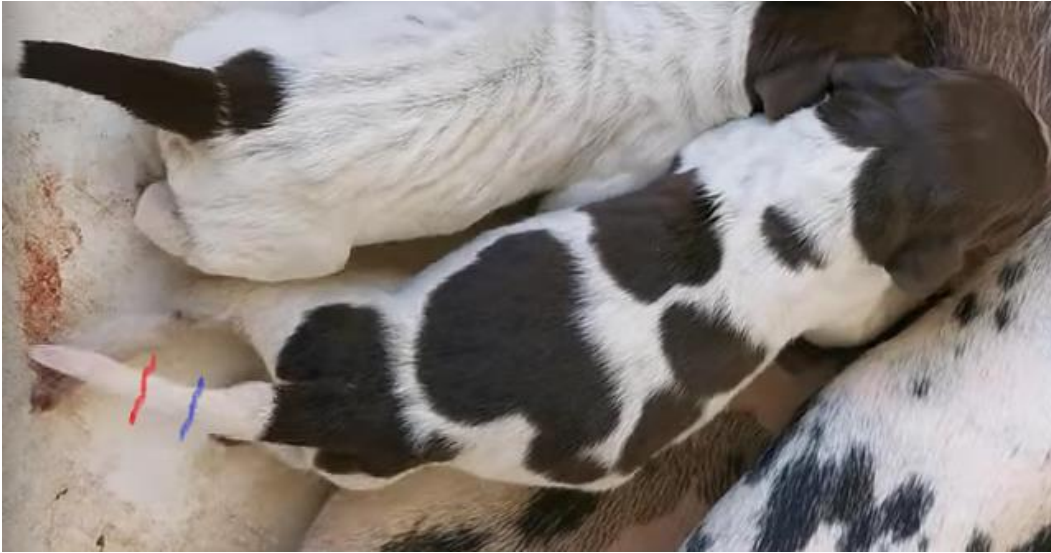
Trait bleu coupe minimum - Trait rouge coupe maximum

On remarque sur la queue du chiot un épaississement de la base jusqu'au tiers environ, qui doit absolument être respecté en entier et dépassé lors de la coupe, sous peine d'avoir des résultats absolument désastreux sur le plan esthétique.